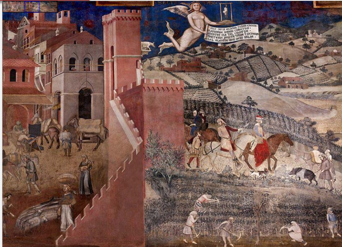
Ambrogio Lorenzetti, Allegoria del buono e del cattivo governo, 1337-40, particolare

Il cyberterritorio come territorio «aumentato»